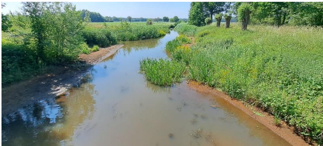
Aa – 1 e categorie – stuw 3 – 8 juni 2023

Sinds 1 januari 2022 geldt een permanent onttrekkingsverbod op alle ecologisch zeer kwetsbare kleine beken in de provincie Antwerpen. Dit verbod blijft van toepassing.